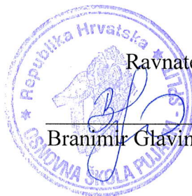
Branimir Glavinović, dipl. uč.